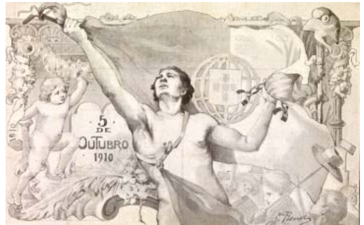
Postal evocativo da Implantação da República, da autoria de G. Renda. (Colecção António Pedro Vicente)

Durante o ano de 2010, a Fundação Mário Soares prevê disponibilizar cerca de um milhão de imagens na Internet, dando assim continuidade ao projecto pioneiro que iniciou em 1996 e que, desde então, tem conhecido um assinalável crescimento.