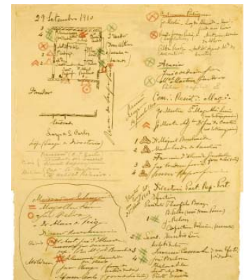
Excerto do desenho de Simões Raposo da reunião decisiva de 29 de Setembro de 1910, que contou com a presença dos principais dirigentes civis e militares do movimento revolucionário. (Documentos Carvalho Duarte)

Proximamente, será também editado o catálogo integral da Coleção António Pedro Vicente.